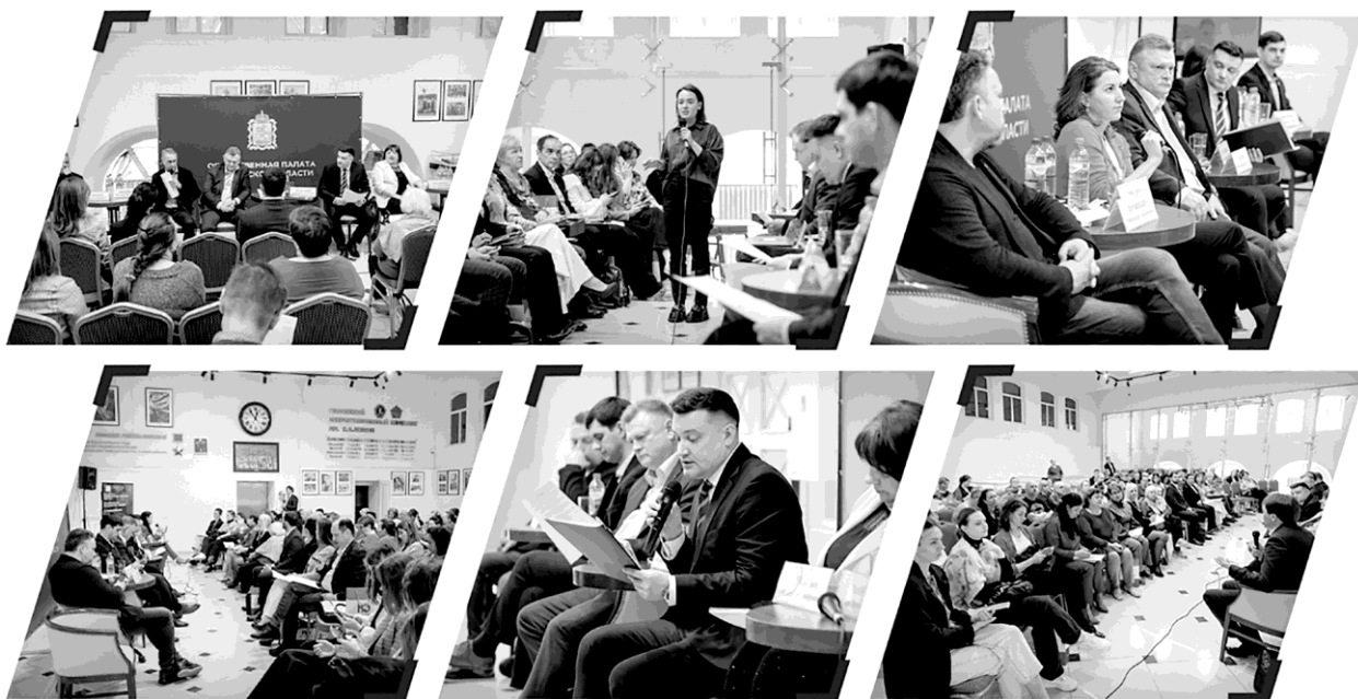
Форум «НКО с нуля»: от регистрации до получения грантов». 27 апреля 2023 года, Ногинск.

В рамках проекта #ЗеленыйРегион были организованы мероприятия по озеленению и благоустройству территорий Подмоскowie. Основное внимание уделялось озеленению урбанизированных территорий и городских агломераций, а также проведению лесовосстановительных работ в регионе. За период реализации проекта было высажено 120000 деревьев